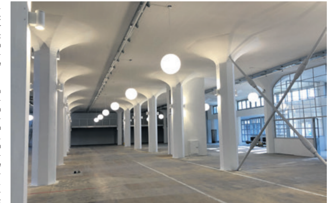
Hohe Decken und einladend hell: Die ehemaligen Lagerhallen sind wie gemacht für Ausstellungen wie jene der Motorworld-Manufaktur.