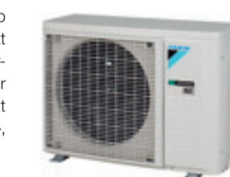
Durch die Installation eines Aussengeräts entsteht bei der Kühlung weniger Lärm im Raum.