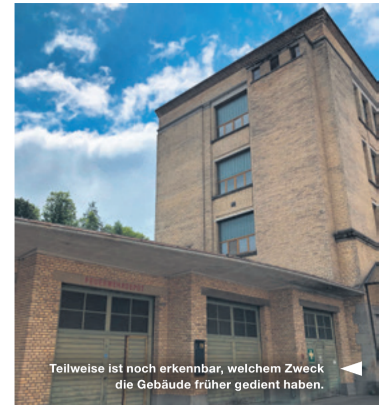
Teilweise ist noch erkennbar, welchem Zweck die Gebäude früher gedient haben.