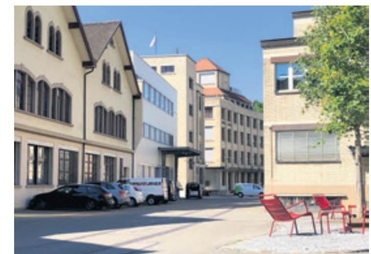
Ein ruhiges Plätzchen: «The Valley» soll nicht nur ein Arbeitsort sein, auch genügend Platz für Begegnungen und den persönlichen Austausch soll geschaffen werden.