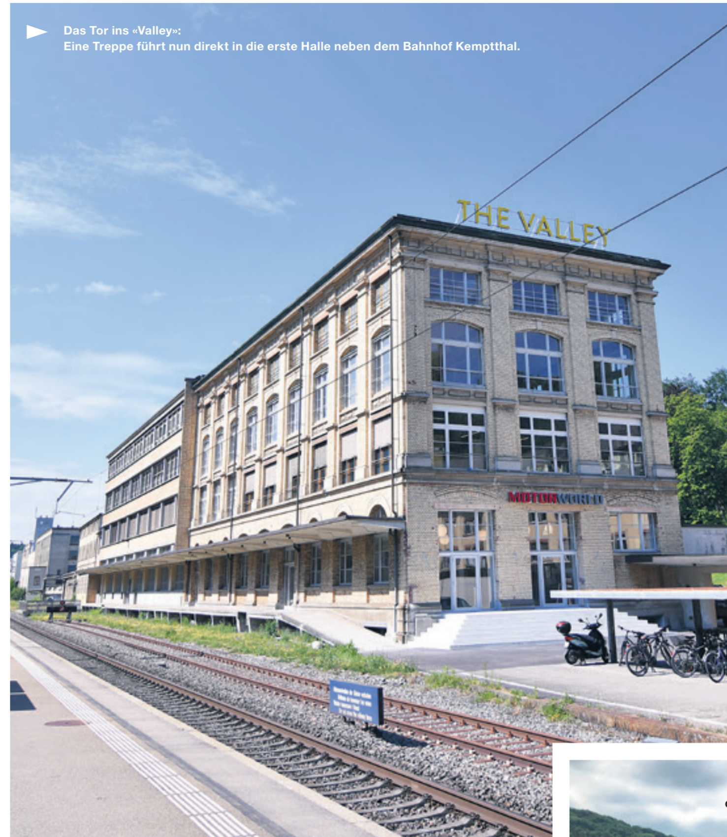
Das Tor ins «Valley»: Eine Treppe führt nun direkt in die erste Halle neben dem Bahnhof Kempththal.