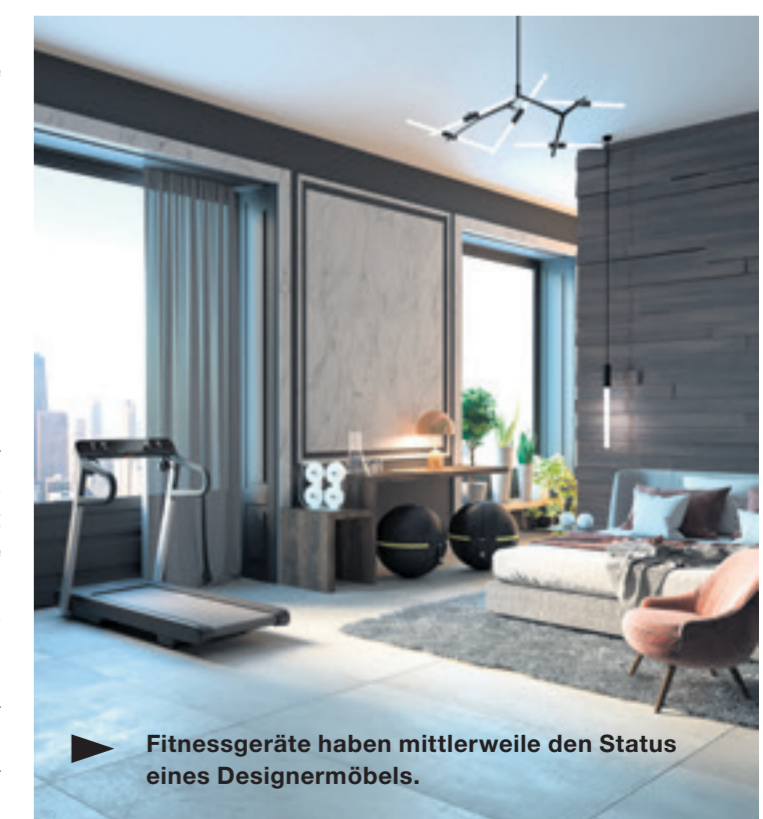
Fitnessgeräte haben mittlerweile den Status eines Designermöbels.