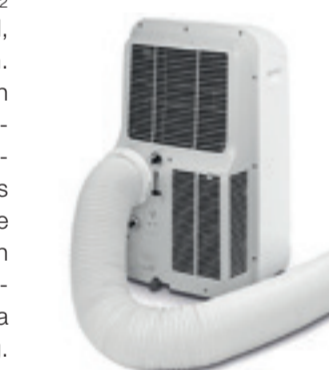
Ein Direktsystem mit Abluftschlauch ist flexibel einsetzbar.