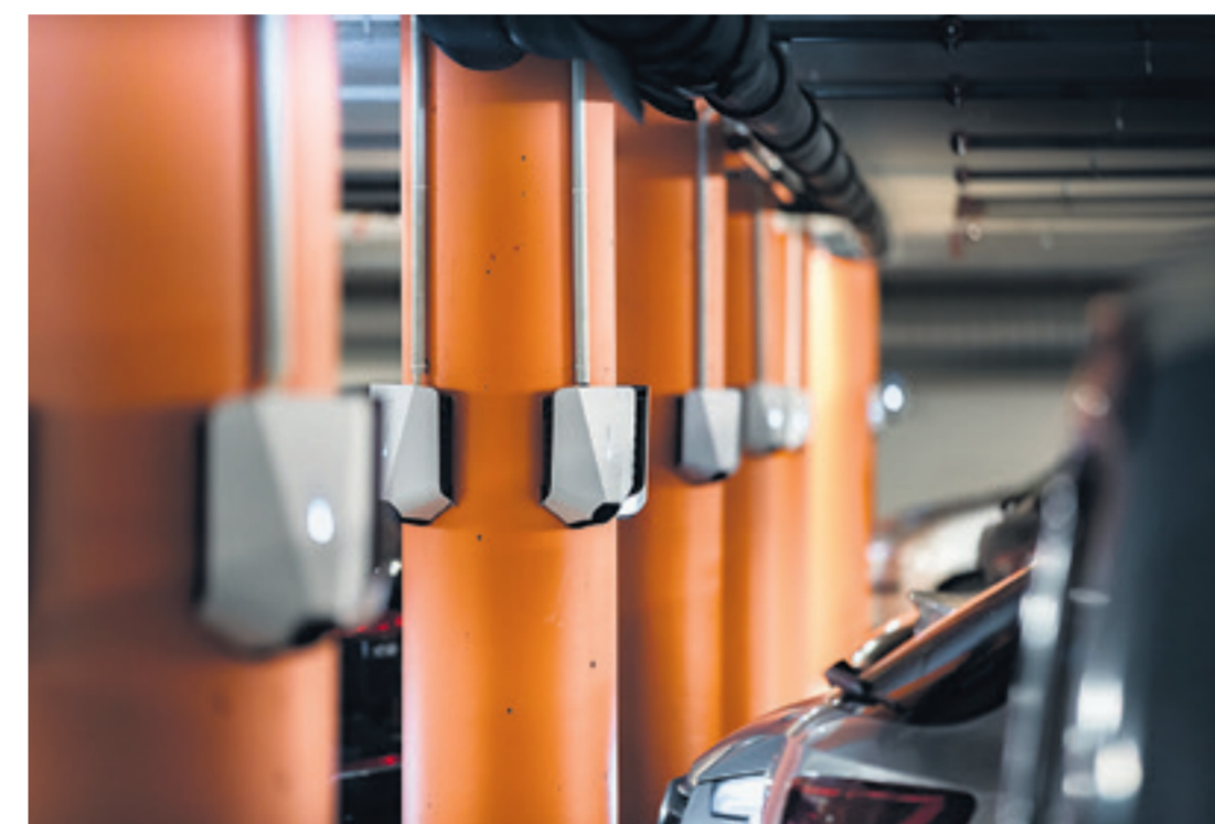
Ladeinfrastruktur in der Tiefgarage einer Liegenschaft.