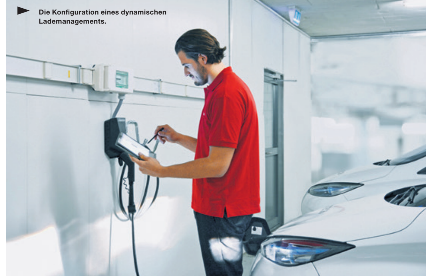
Die Konfiguration eines dynamischen Lademanagements.