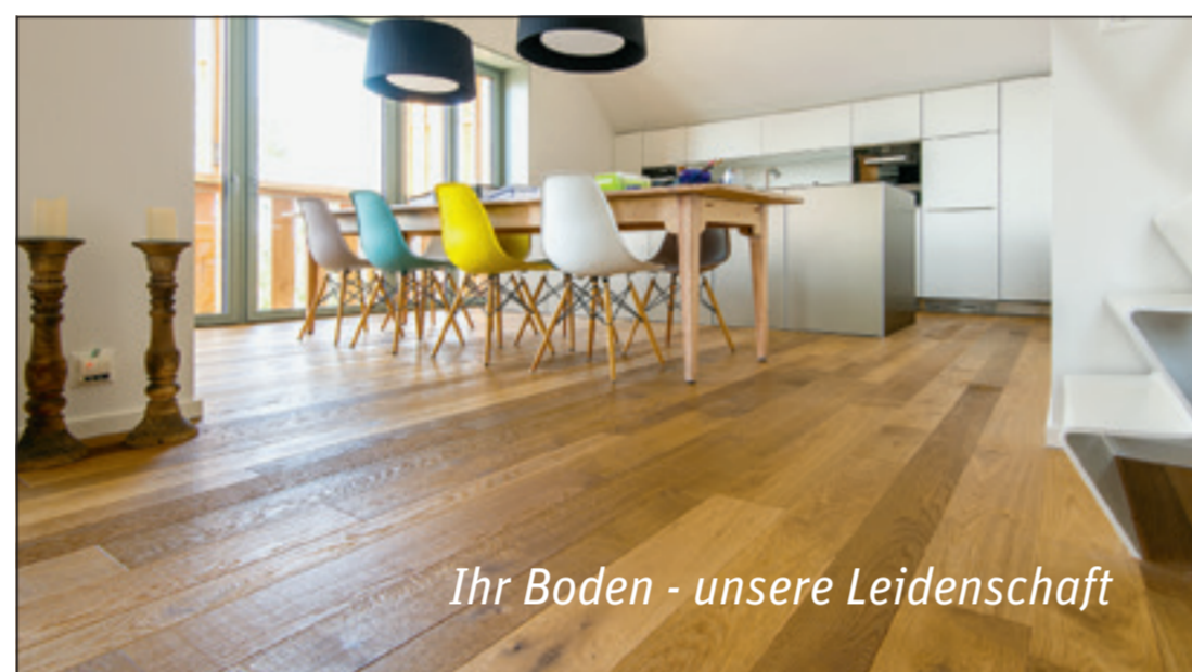
Ihr Boden - unsere Leidenschaft