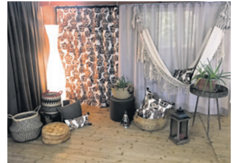
Wenn es im Boho-Stil um Accessoires geht, darf man seiner Fantasie freien Lauf lassen.

Auch eine alte Kiste, die als Regal verwendet wird, Sofas im Leinenlook, Geflecht aus Rattan sowie bemusterte Tapeten gelten als Boho. Viele solcher Stücke findet man in Brockenhäusern. Aus ganz normalen, in unifarben gehaltenen Räumen kann mit wenigen Handgriffen so einiges rausgeholt werden. Fransen, Traumfänger und Spiegel mit Bastrahmen sind typische Accessoires. Die Natürlichkeit des Stils kommt also von den Naturmaterialien und deren Erdtönen. Federn, Steine, Baumwolle und auch Flachs sind als Materialien sehr beliebt. Sie verändern eine Raumatmosphäre sofort. Auch Tierdarstellungen in Bildern oder Figuren gehören dazu. Vögel hätten beispielsweise die Bedeutung von Freiheit und Elefanten von positiver Energie.