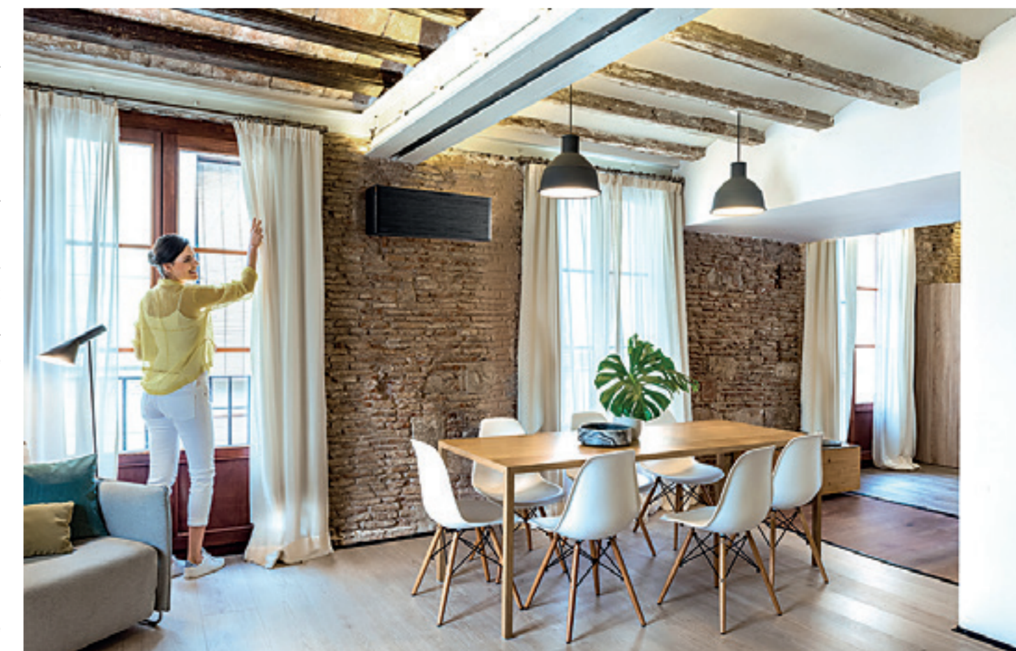
Mit einem an die Einrichtung angepassten Design fällt das Innengerät eines Splitsystems kaum auf.