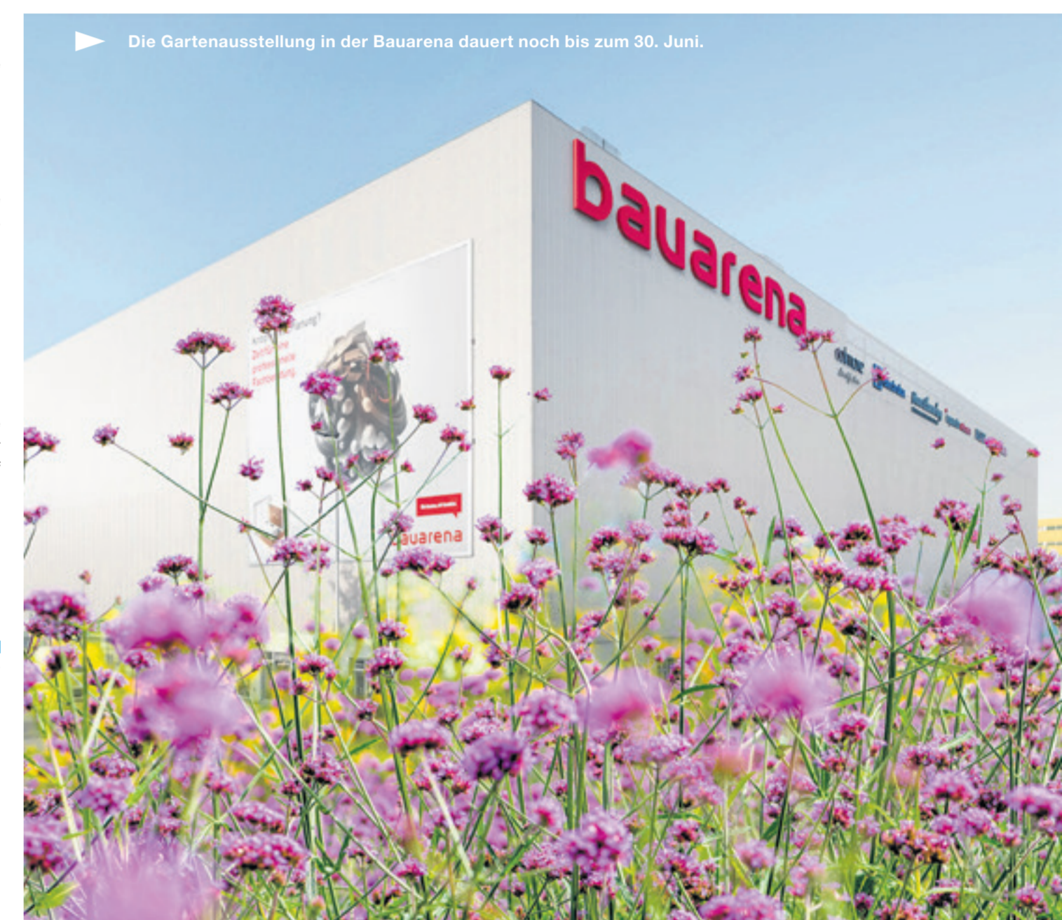
Die Gartenausstellung in der Bauarena dauert noch bis zum 30. Juni.

Öffnungszeiten Mo bis Fr 9-18 Uhr Sa 9-16 Uhr