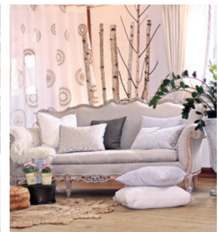
Das Atelier Garekla Design versprüht Gemütlichkeit und Leichtigkeit.