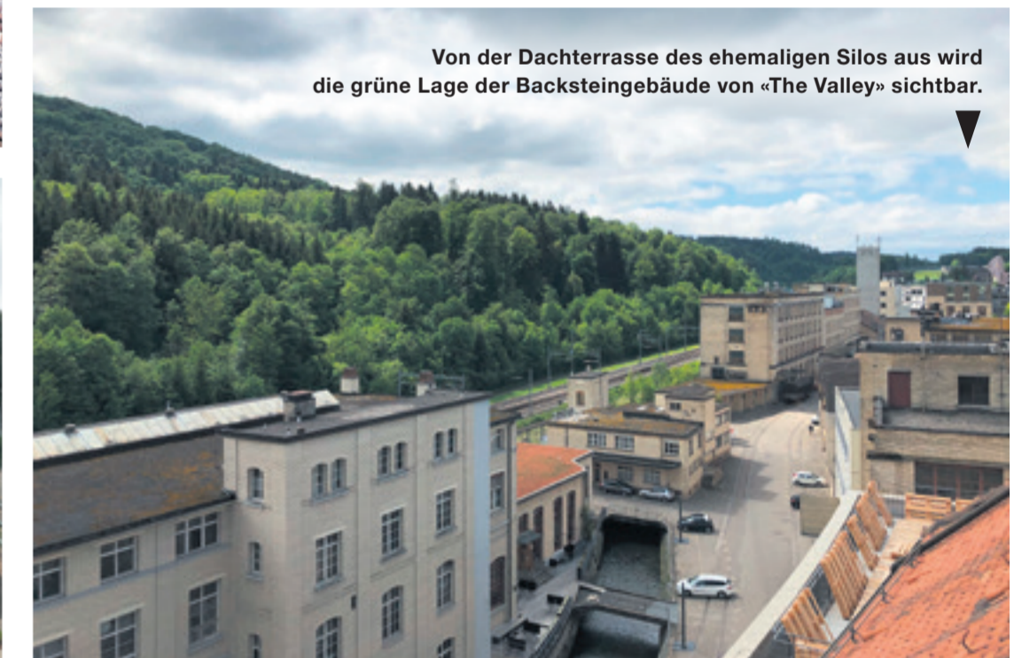
Von der Dachterrasse des ehemaligen Silos aus wird die grüne Lage der Backsteingebäude von «The Valley» sichtbar.