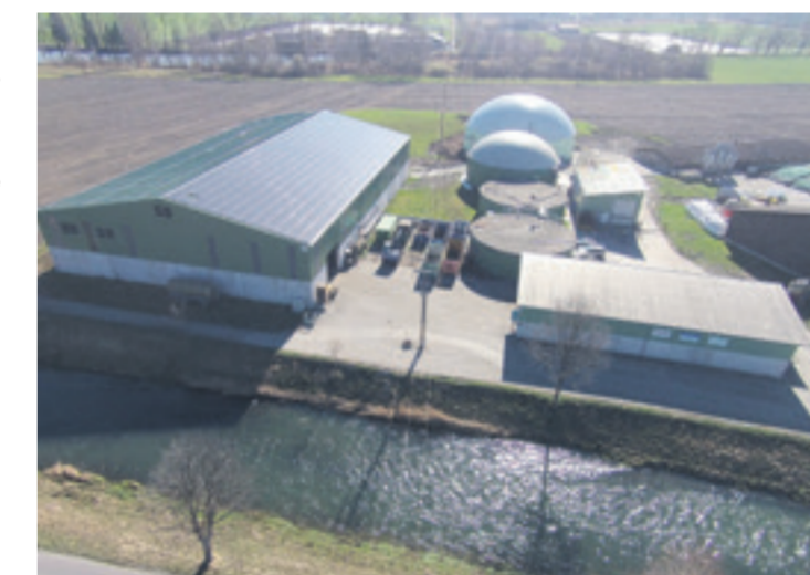
In lokalen Biogas-Anlagen wird aus Grüngut, Gülle, Mist und Gastronomieabfällen klimaneutrales Biogas erzeugt, welches über das Netz der EZO Energie AG bezogen werden kann. Heizen mit Gas ist günstig, effizient und ökologisch.

EZO Energie AG Mettlenbachstrasse 29 8617 Mönchaltorf Telefon 044 206 60 00 info@ezoenergie.ch www.ezoenergie.ch