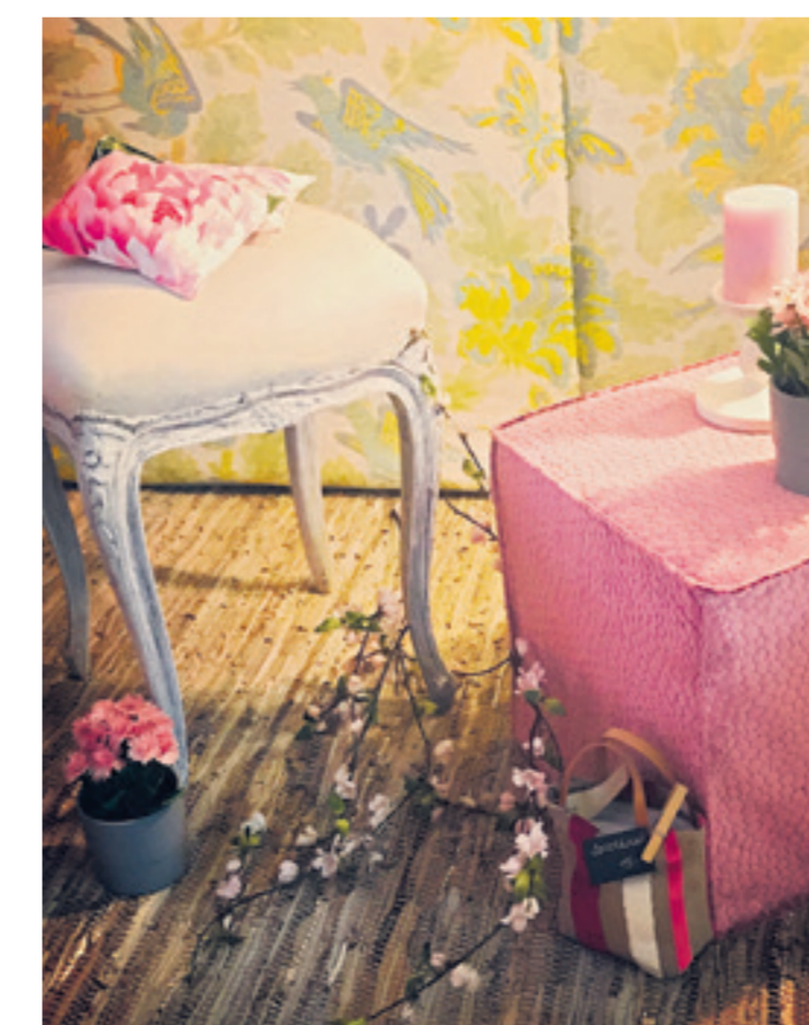
«Kombinationen dürfen sich auch mal beißen. Sie können trotzdem harmonieren», sagt Sabine Angst.

Das Verlangen nach Natürlichkeit und Nachhaltigkeit wird gemäss Sabine Angst in Zukunft weiter an Bedeutung gewinnen. Diese Eigenschaften verkörpert der Boho-Stil und macht ihn sehr gefragt. Die Möbel sind oft vintage und retro, kombiniert mit neuen Einrichtungsgegenständen. Es handelt sich um Sitzmö-