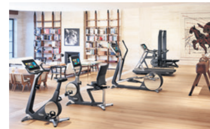
Beratung zur Einrichtung des eigenen Fitnessraums erhalten Sportbegeisterte in der Bauarena in Volketswil oder in der neuen Technogym-Boutique in Zürich.