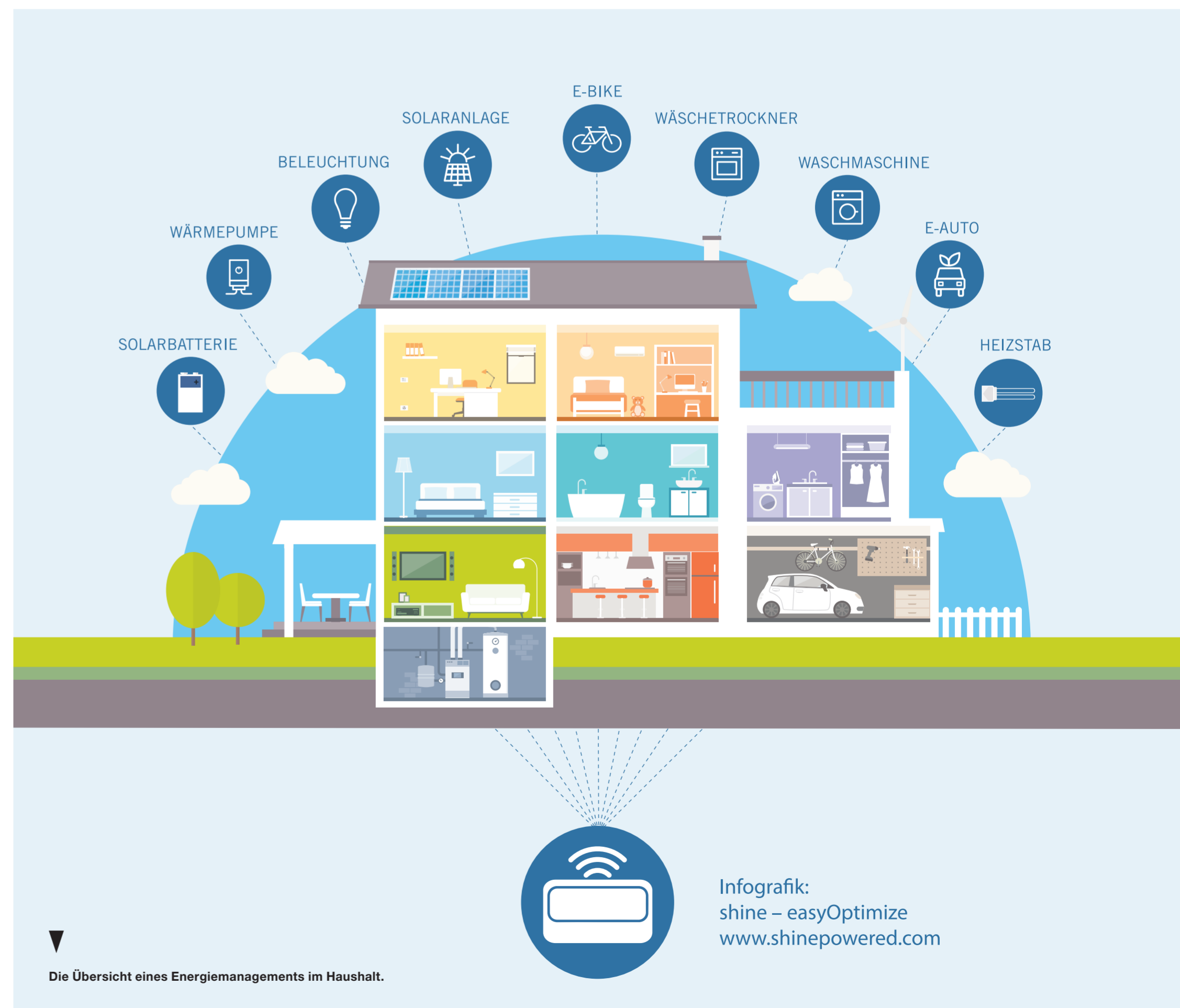
Die Übersicht eines Energiemanagements im Haushalt.